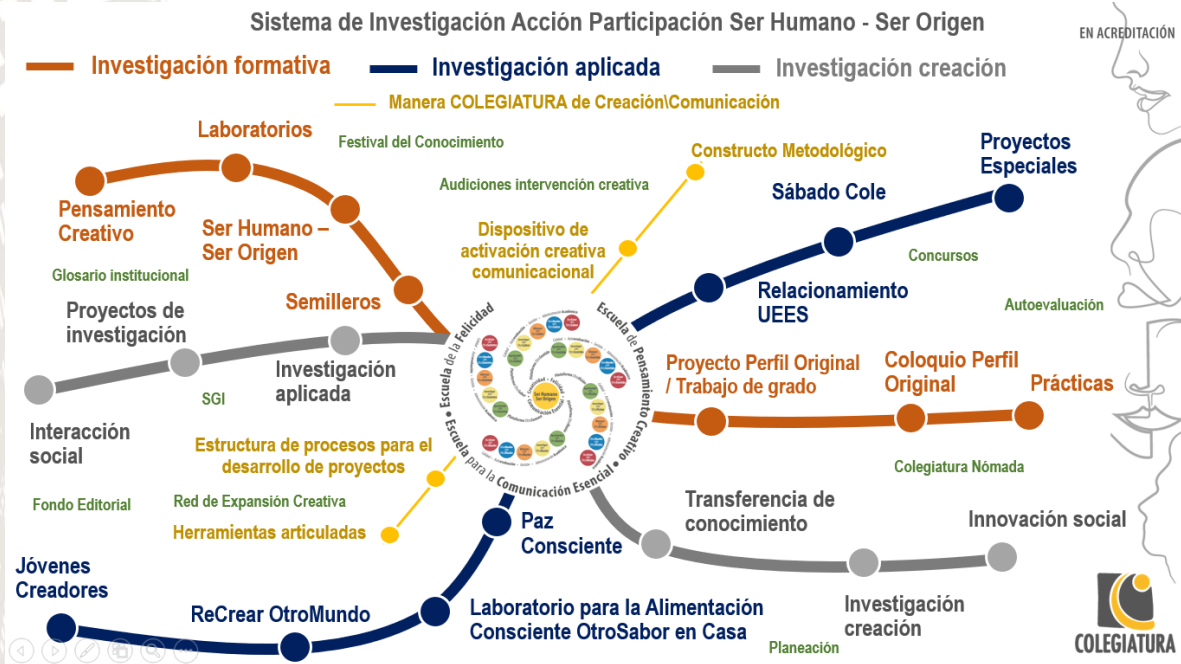
Figura 2 Representación del Sistema de Investigación Acción Participación Ser Humano-Ser Origen