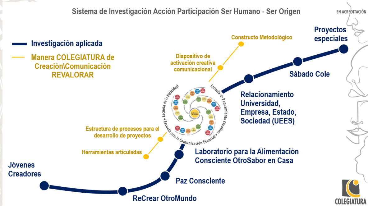
Figura 4 Representación gráfica del campo de investigación aplicada