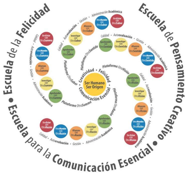
Figura 1 Matriz Estratégica OtroMundo

Al estar inspirada, dinamizada y articulada la investigación en la Matriz Estratégica OtroMundo la lógica de desarrollo investigativo en COLEGIATURA es transversal a todos los procesos de la institución, desde la inter y transdisciplinariedad de los investigadores, docentes y estudiantes de todas las plataformas y de las diferentes escuelas de la institución.